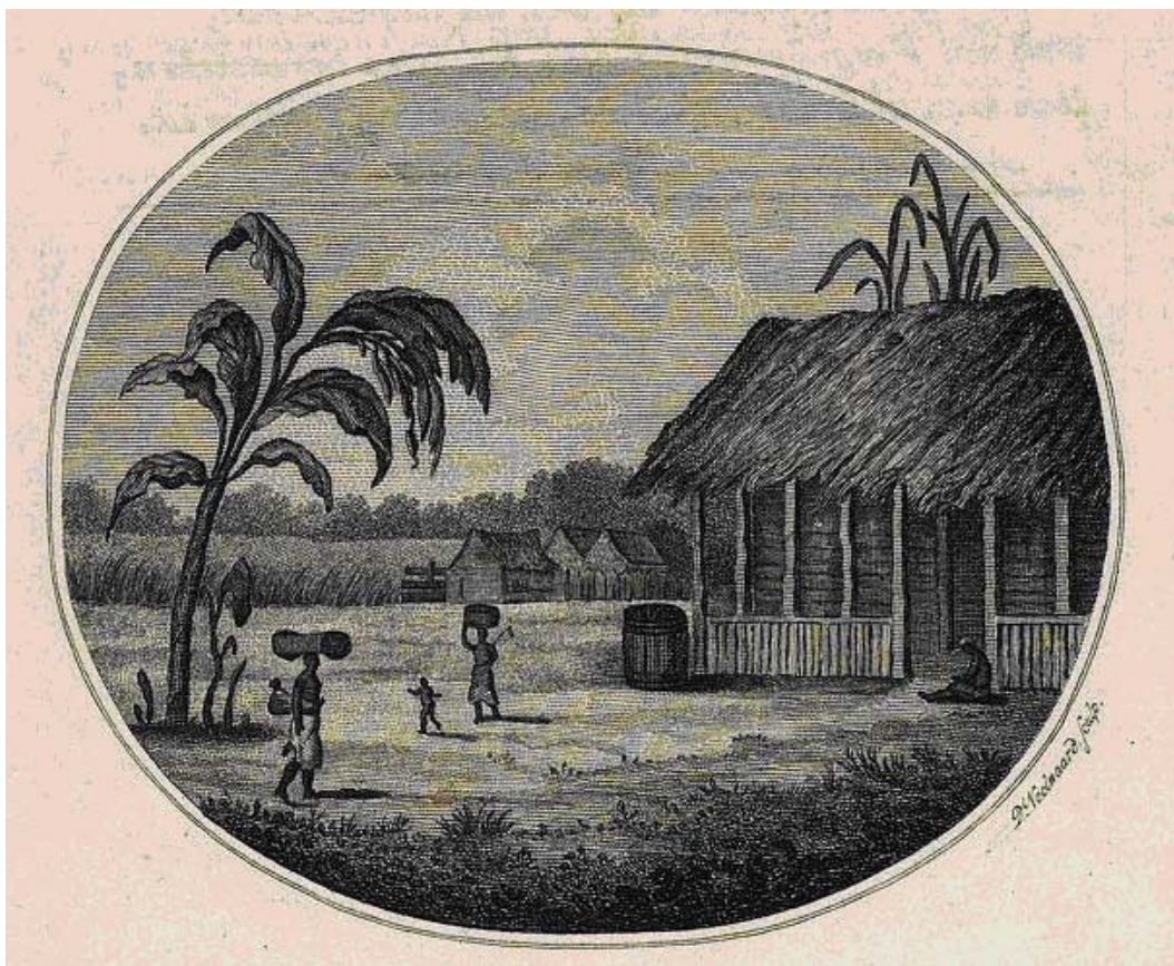
Frontispiece uit een boek uit 1828: Kuhn, F. A. (1828) Beschouwing van den toestand van de Surinaamsche Plantage slaven. Een oeconomisch-geneeskundige bijdrage tot verbetering van deszelve . Amsterdam: C. G. Sulpke

Dit is de eerste empirische studie waarin de invloed van volwassen tweede taalsprekers in de ontwikkeling van creooltalen wordt onderzocht op basis van comparatief taalhistorisch onderzoek in combinatie met hedendaags taalverwervingsonderzoek en codewisselingsonderzoek. Het geeft een nieuw en fundamenteel inzicht in de rol van volwassenen in de ontwikkeling van creooltalen in het bijzonder en in de universele principes van taalontwikkeling en taal in het algemeen.